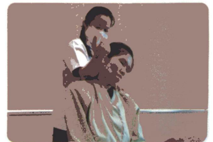
อาชีพนวดแผนไทย