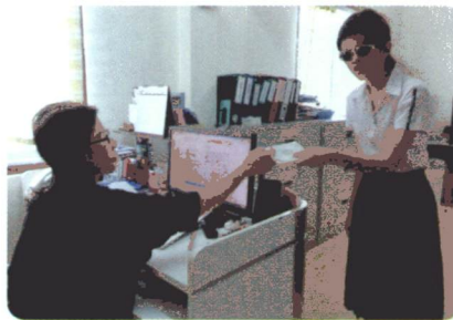
บริการหนังสือเสียงเดซี