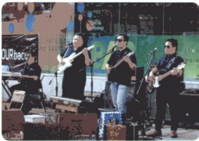
นักร้อง นักดนตรี