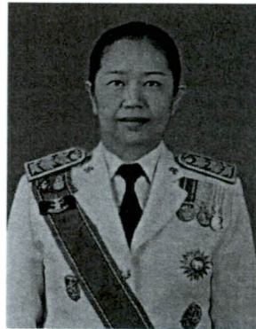
๗. นางภัทรา ไชว์ศรี รองผู้ว่าการตรวจเงินแผ่นดิน