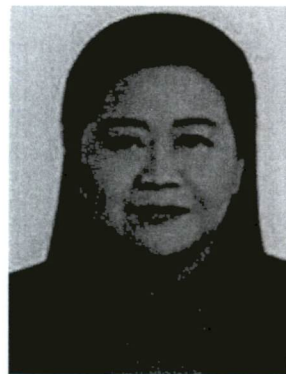
๒. นางดวงตา ตันโช อดีตนายกบริหารราชบัณฑิตยสภา