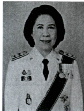
๖. นางเก็ลตันที มโนสันดี รองผู้ว่าการตรวจเงินแผ่นดิน