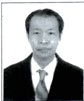
๓. นายเชิดชู รักตะบุตร ข้าราชการบำนาญ (อดีตเอกอัครราชทูต ณ กรุงโรม) กระทรวงการต่างประเทศ