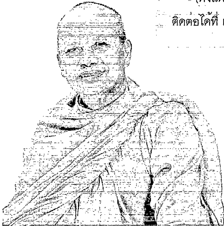
(พระพะยอม กลฺยาณ)

ขอเชิญร่วมบริจาคสิ่งของเหลือใช้ทุกชนิด เพื่อจัดกิจกรรม “ทอดผ้าป่าสามัคคี ขยะรีไซเคิล”